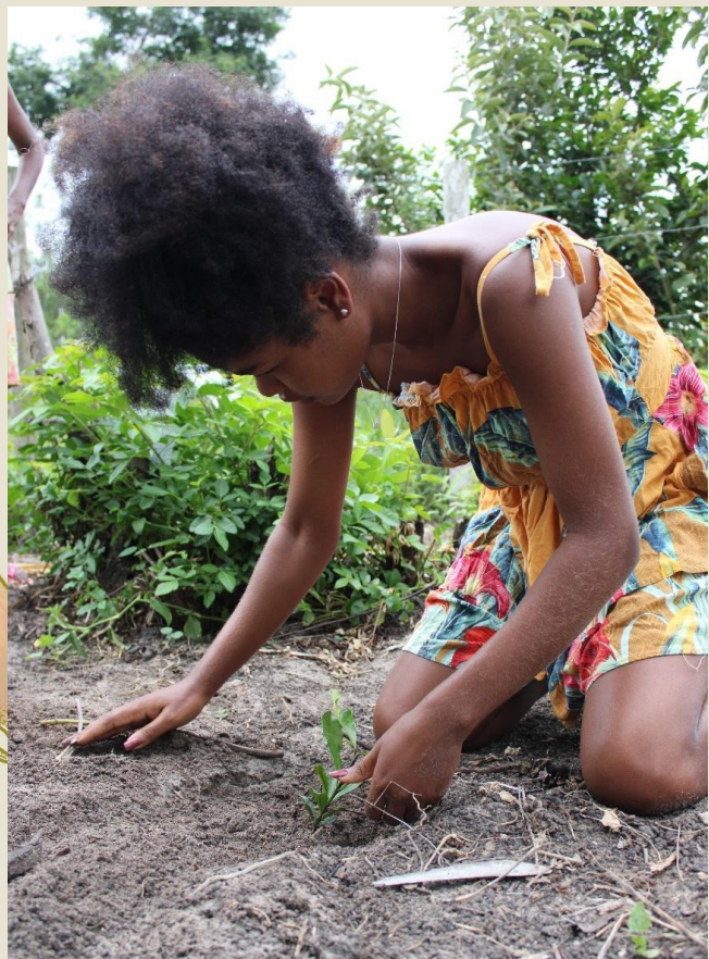
Plantio de pomar na comunidade Arara, Teixeira de Freitas/BA