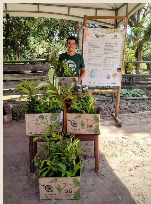
Stand do projeto no dia de campo na fazenda Presente, Alcobça/BA