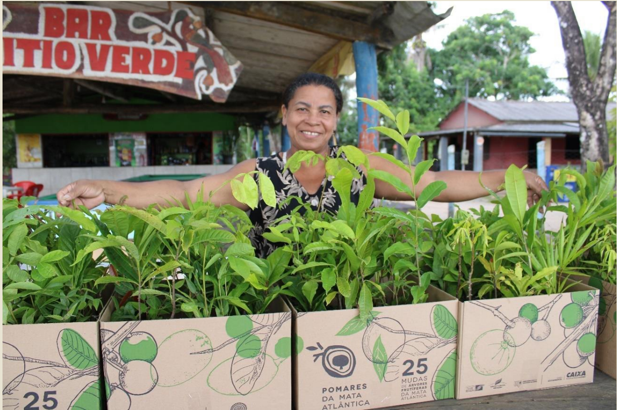
Entrega de mudas na comunidade Arara, Teixeira de Freitas/BA