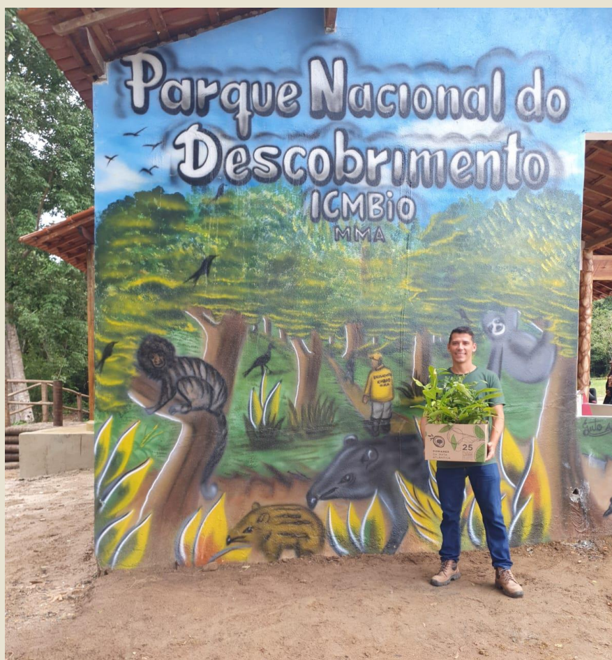
Doação de mudas para plantio de pomar no Parque Nacional do Descobrimento, Prado/BA

No dia 20 de abril de 2023 o Parque Nacional do Descobrimento, localizado no município de Prado/BA, completou 24 anos e para comemorar seu aniversário foi realizado um evento no dia 23 de abril. O evento contou com aula de ioga, passeios ecológicos, feirinha agroecológica, apresentação da brigada de incêndio, plantio de bosque, apresentação de bacia de evapotranspiração, foi realizada a cerimônia de posse dos conselheiros do parque, entre outras atividades. O projeto Pomares da Mata Atlântica foi convidado a realizar a apresentação do projeto no evento e implantar um pomar junto aos convidados na área de convivência do Parque. Os participantes tiveram a oportunidade de conhecer mais sobre as frutíferas nativas da Mata Atlântica e vivenciar esse plantio colocando a “mão na massa”.