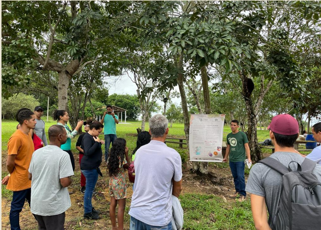
Apresentação do projeto Pomares da Mata Atlântica, Prado/BA