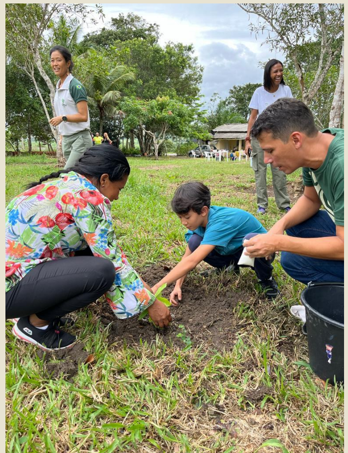
Plantio de pomar no Parque Nacional do Descobrimento, Prado/BA