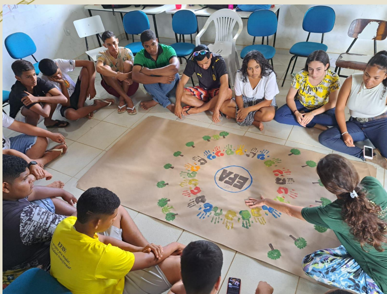
Planejamento das ações no SAF com o 4º ano do Ensino Médio na EFA em Montanha/EA.

Na EFA – Escola Família Agrícola de Vinhático em Montanha/ES será dada continuidade das ações de implantação do SAF – Sistema Agroflorestal com o 3º ano do ensino médio, e também será iniciado o processo de restauração florestal em uma microbacia junto aos alunos do 7º ano do Ensino Fundamental. O 4º ano, turma que iniciou a implementação do SAF ano passado, vai ajudar na gestão do SAF.