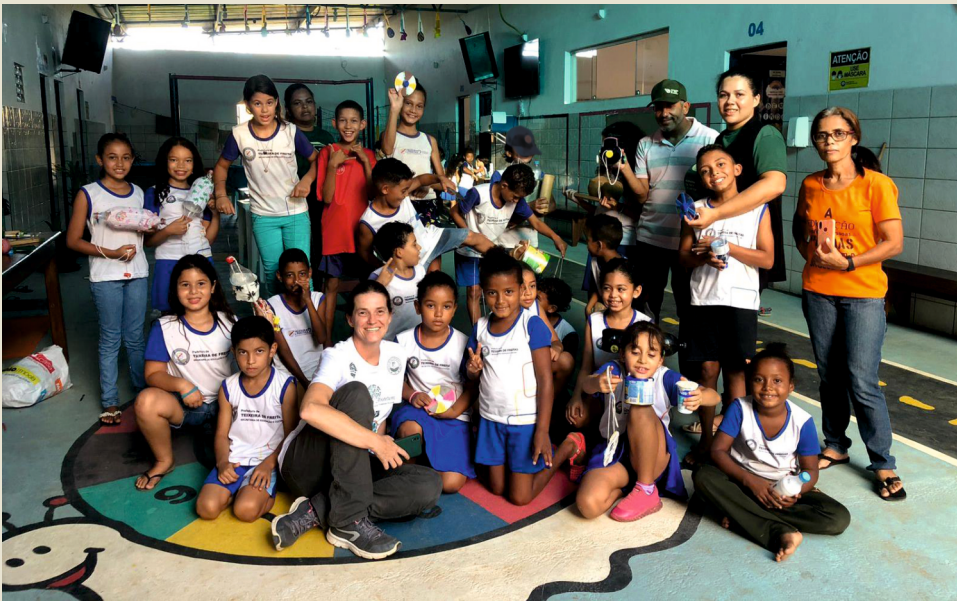
Oficina de reutilização de materiais recicláveis com alunos da Ed. Infantil e Ensino Fundamental I em Jardim Novo Teixeira de Freitas/BA

Na Escola Municipal Novos Tempos em Jardim Novo – Teixeira de Freitas/BA terão continuidade as atividades de EA com as turmas do 6º ao 9º ano e também da Educação Infantil até 5º ano, e foi iniciada a formação em EA com professores, funcionário e direção escolar.