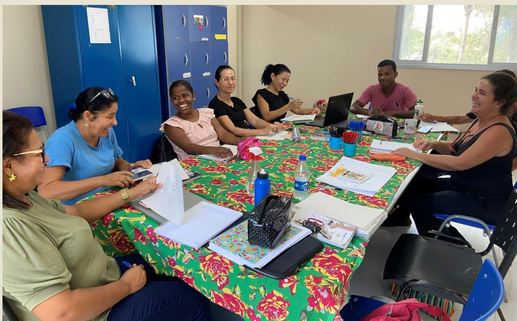
Planejamento com professores na Escola Valdício Barbosa em Conceição da Barra/ES

Na Escola Estadual Valdício Barbosa dos Santos, que fica no assentamento de mesmo nome, houve início das atividades em março ainda em fase de planejamento. A ideia é a construção de um processo ao longo desse ano.