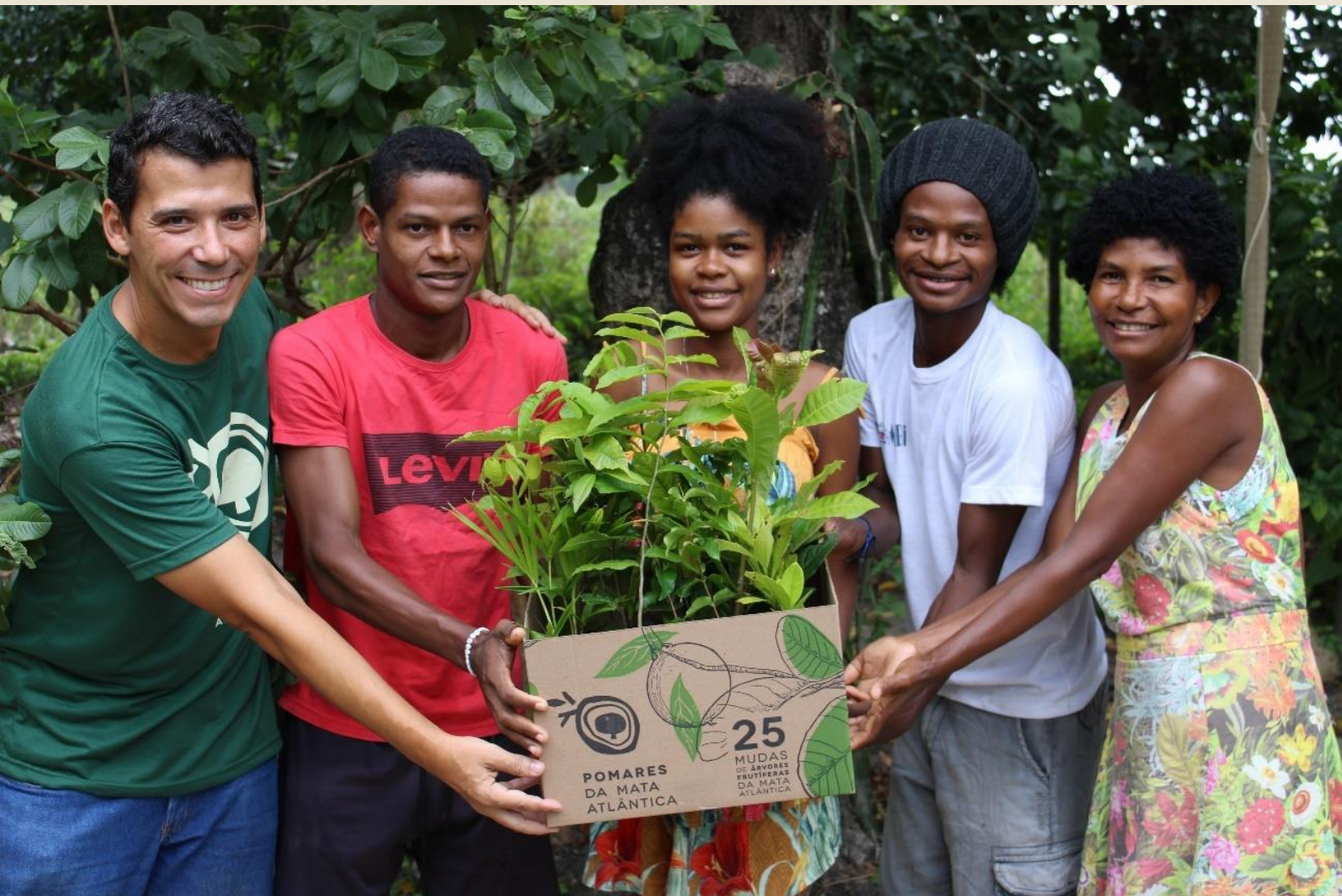
Entrega de mudas na comunidade Arara, Teixeira de Freitas/BA