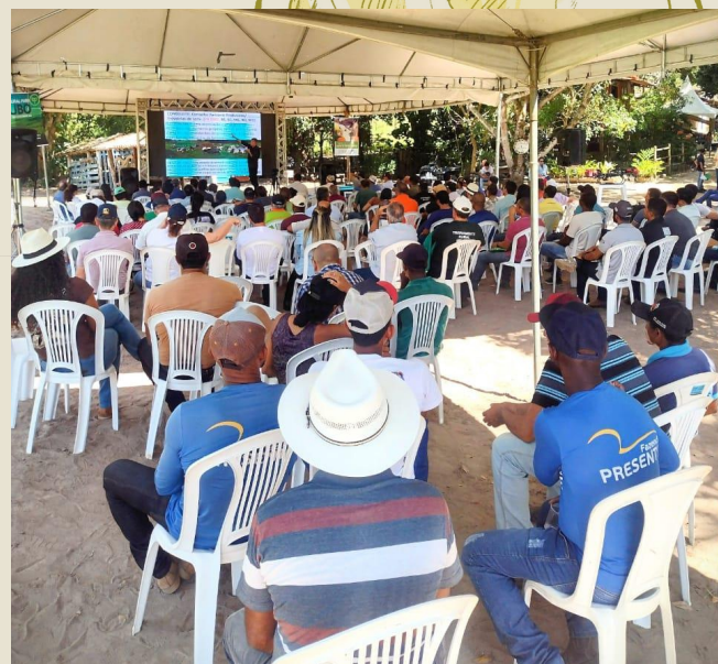
Dia de campo na fazenda Presente, Alcobça/BA