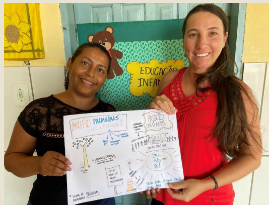
Planejamento com professores na Escola em Córrego das Palmeiras Conceição da Barra/ES

Na Escola do Córrego das Palmeiras em Conceição da Barra/ES foi realizado o planejamento e avaliação das ações de 2022 com a previsão de alguns encontros ainda neste semestre, como a Trilha Ecológica no Parque Estadual de Itaúnas previsto para 11 de maio deste ano.