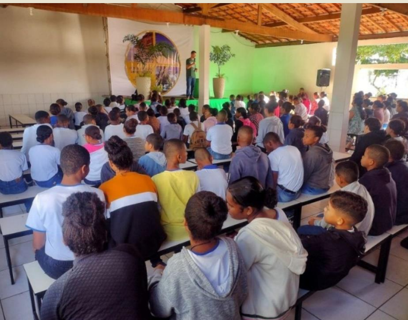
Palestra no I Fórum Ambiental para os alunos da rede de ensino em Prado/BA