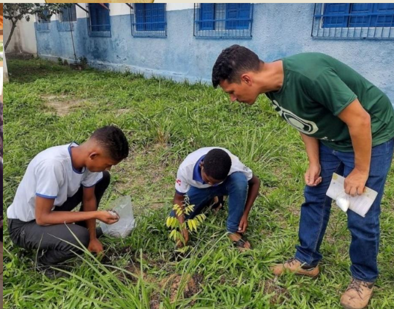
Plantio de pomar com os alunos do 6º ano do Colégio Anísio Teixeira em Prado/BA