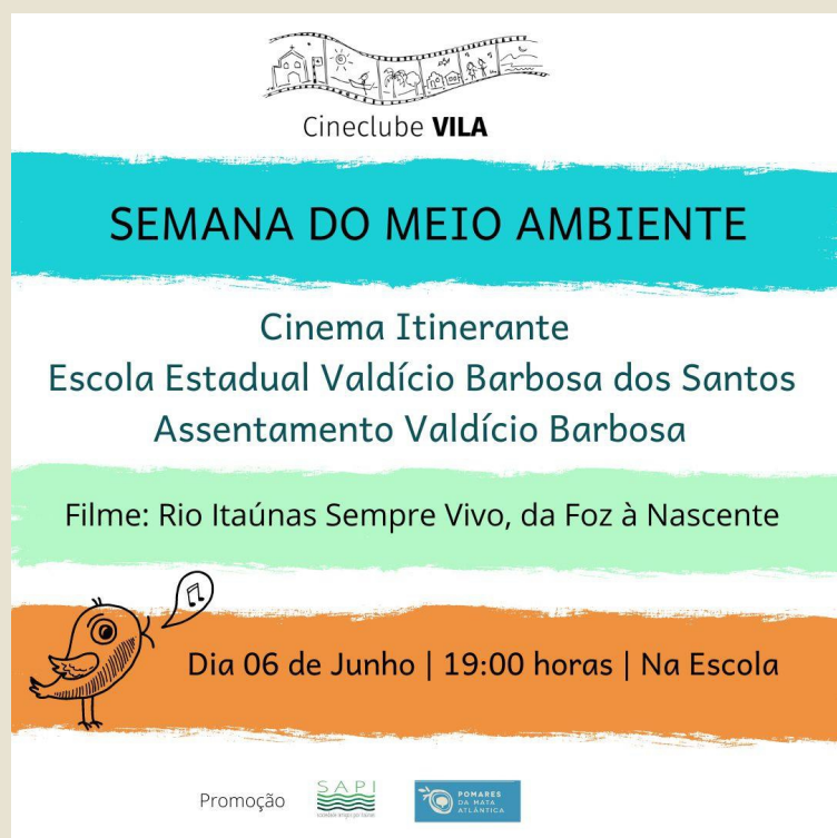
Cartaz de divulgação do Cineclube na escola Valdício Barbosa em Conceição da Barra/ES

Ainda em comemoração à Semana do Meio Ambiente, a equipe de EA do projeto realizou no dia 06 de junho com alunos da EJA – Educação de Jovens e Adultos na Escola Estadual Valdício Barbosa dos Santos em Conceição da Barra/ES a exibição do filme “Rio Itaúnas Sempre Vivo, da Foz à nascente”. Após a exibição do filme houve o debate sobre a importância da proteção do Rio Itaúnas que margeia o Assentamento Valdício Barbosa.