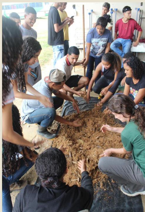
Oficina de Biofertilizante com alunos da EFA em Montanha/ES

No dia 28 de junho realizamos atividades na EFA – Escola Família Agrícola de Vinhático em Montanha/ES com a capacitação sobre bioinsumos. Nessa escola, o projeto realiza atividades junto aos alunos do 3º ano do ensino médio com a implantação de um sistema agroflorestal (SAF) como ambiente de aprendizagem abordando formas mais ecológicas e sustentáveis de produção agrícola alinhado a proteção ambiental. Neste dia realizamos 2 oficinas práticas de produção de bioinsumos orgânicos que serão aplicados, depois de prontos, na SAF da escola.