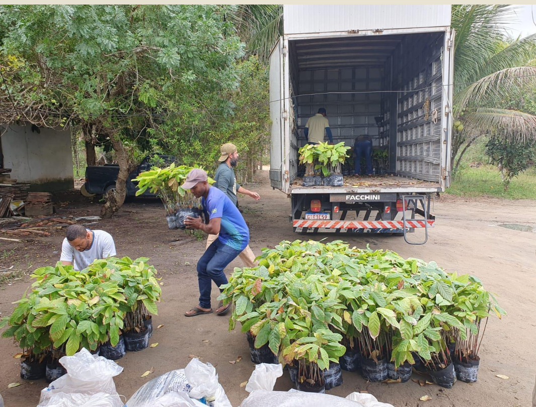
Entrega de mudas de Cacau em Rancho Queimado, Alcoaça/BA

Seis comunidades beneficiárias do projeto receberam mudas de cacau para plantio nos SAFs já implantados, à saber: Rancho Queimado, Alcoaça/BA; assentamento Riacho das Ostras, Prado/BA; Jardim Novo, Teixeira de Freitas/BA; assentamento Paulo Freire, Mucuri/BA; Córrego do Artur e assentamento Rio Preto de Itáunas (100 Alqueires), Conceição da Barra/ES.