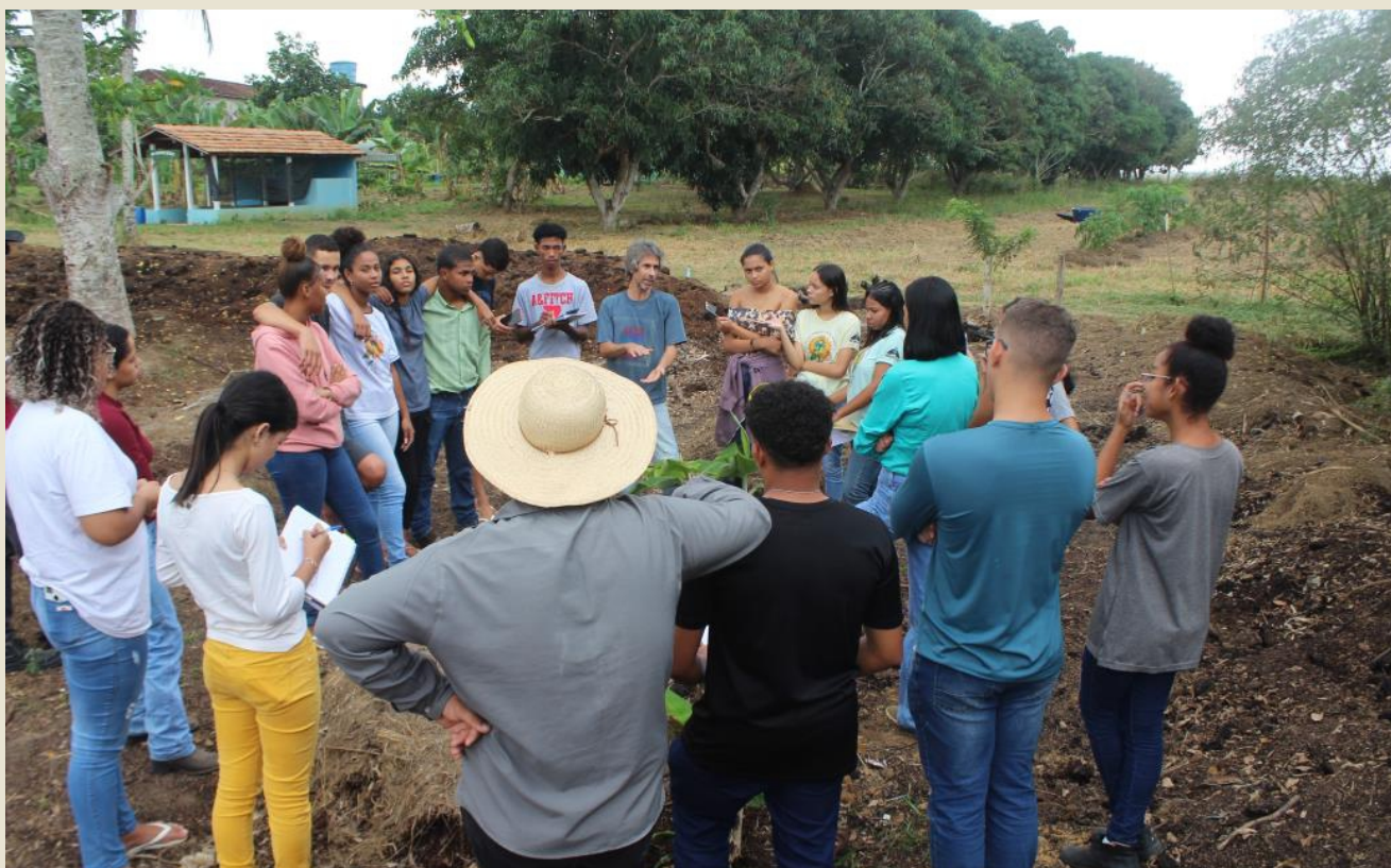
Oficina de compostagem de resíduos orgânicos na EFA em Montanha/ES