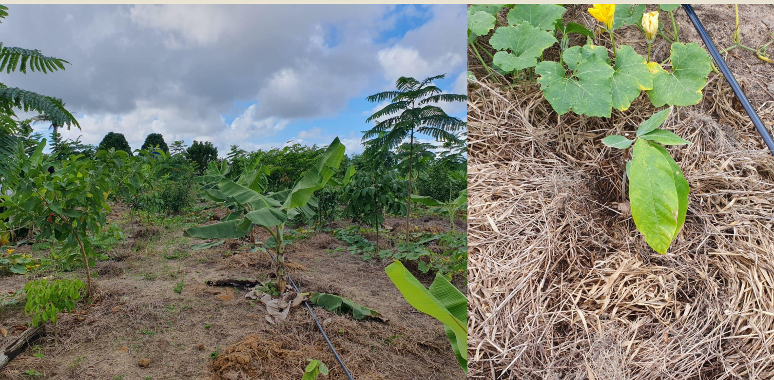
Plantio de Cacau em SAFs no Assentamento Paulo Freire, Mucuri/BA