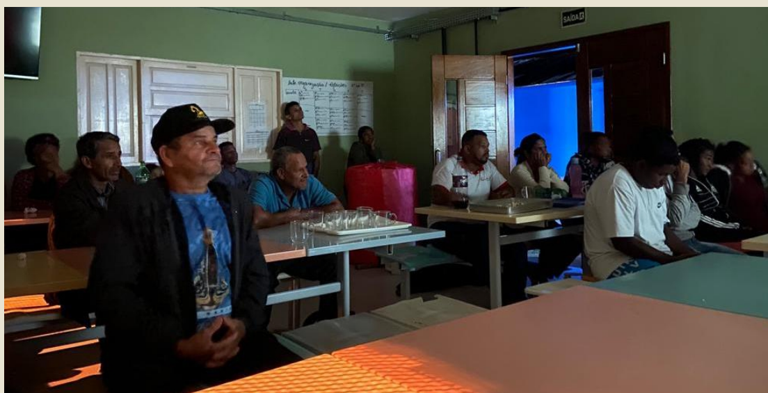
Alunos da EJA assistindo o filme na escola do Assentamento Valdício Barbosa