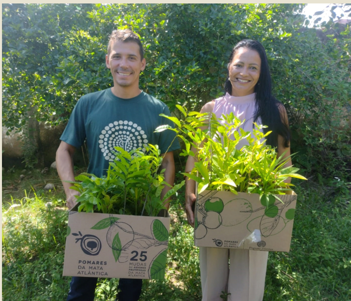
Entrega de caixas do Pomares para comunidades no Espírito Santo