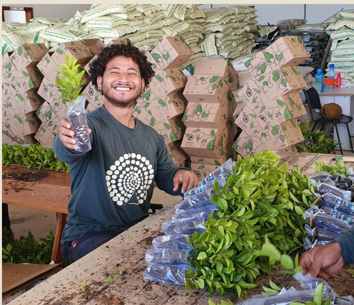
Organização para doação das mudas frutíferas