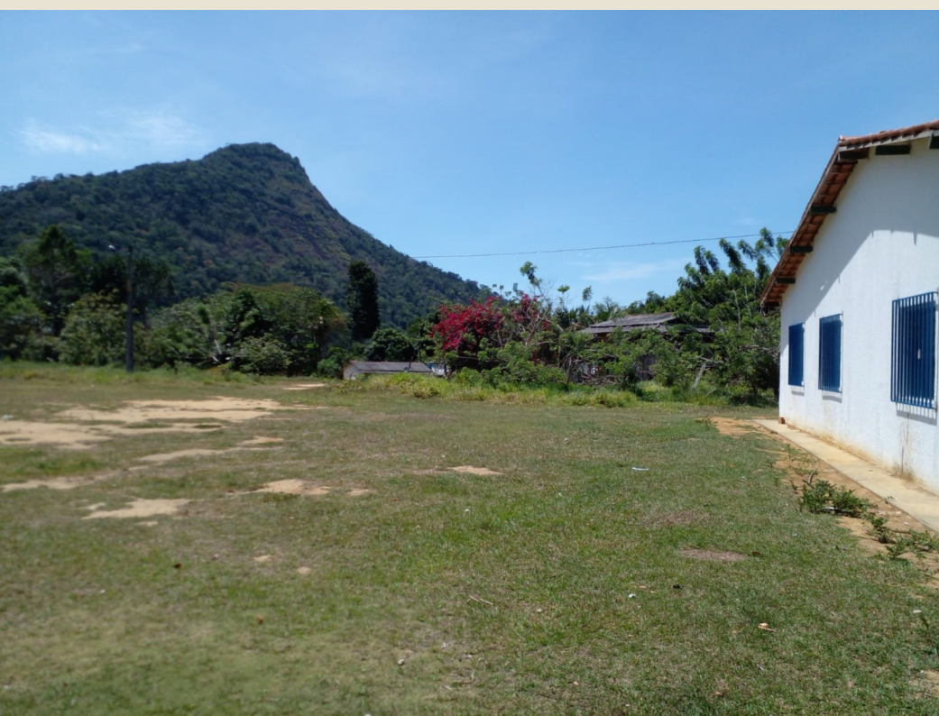
Escola Pataxó no Pé do Monte

Na escola do Pé do Monte, estamos em fase de planejamento junto aos professores para pensar as possibilidades de ações de EA de acordo com as necessidades da escola e a realidade socioambiental da aldeia. Essa escola fica no entorno do Parque Nacional do Monte Pascoal, uma região rica em biodiversidade florestal. Os indígenas dessa aldeia já são parceiros antigos do Arboretum pois são coletores de sementes para a produção de mudas na base do Programa.