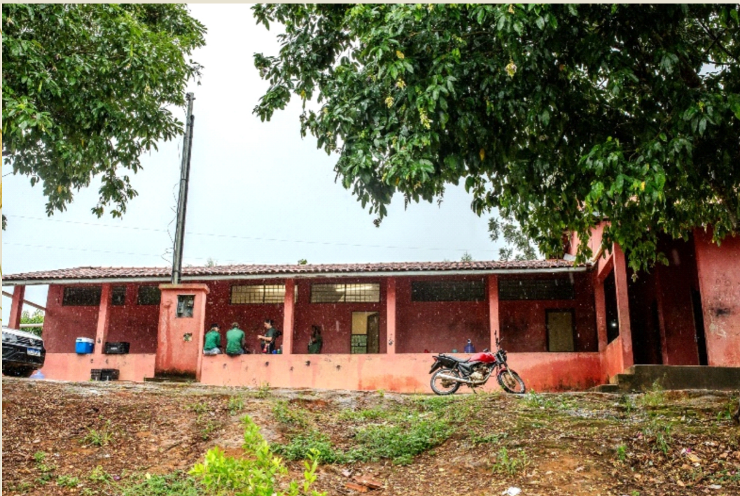
Escola sede Maxakali

Na escola Maxakali a proposta acordada com a direção e o corpo docente é trabalhar a formação continuada em Educação Ambiental de professores do Ensino Fundamental II para estruturar as ações juntos aos alunos. A partir dessa formação inicial a ideia é ir avançando para um projeto de EA para toda a escola.