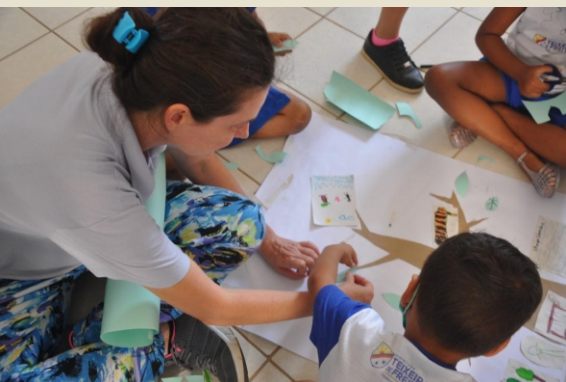
Atividades de EA na Escola em Jardim Novo Teixeira de Freitas/BA

As atividades de EA nas escolas do projeto Pomares da Mata Atlântica é um processo de construção feito junto aos alunos, professores e comunidade escolar buscando a valorização, a conexão e a ampliação do conhecimento de todos sobre a Floresta.