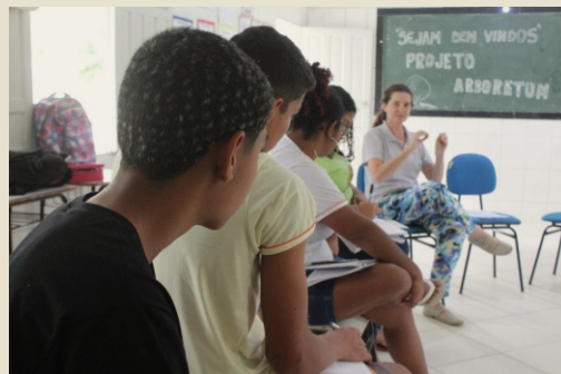
Atividade na EFA em Montanha/ES.

Na EFA – Escola Família Agrícola de Vinhático em Montanha/ES já foram realizados 3 encontros nos dias 03, 17 e 31 de agosto onde o foco foi conhecer os alunos, a escola e as comunidades de onde vieram os alunos. Nesta escola estão ocorrendo atividades com a turma do 3º ano do Ensino Médio com o intuito de construir um SAF como ambiente de aprendizagem trazendo para dentro desse processo educativo toda a importância da conservação e preservação da Mata Atlântica.