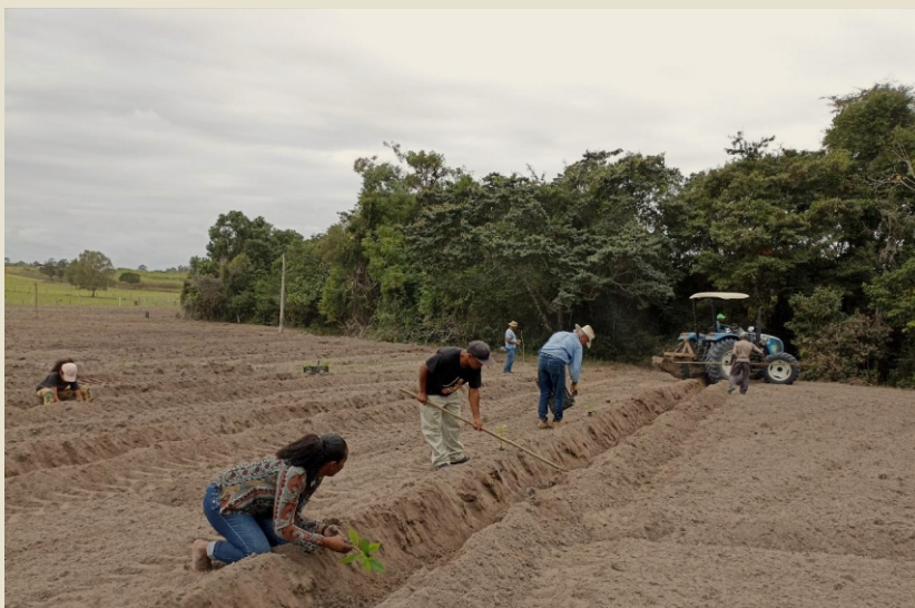
Restauração de nascente na comunidade de Arara em Teixeira de Freitas/BA.

Em Arara foi realizada a restauração de 2 nascentes com a participação de 2 escolas municipais onde foram plantadas 3.334 mudas em forma mutirão com a presença de 53 pessoas nos 2 eventos. O primeiro plantio realizado no dia 05 de agosto contou com a participação de 12 alunos, 3 professores da Escola Municipal Arara de Teixeira de Freitas/BA, mais 8 pessoas da comunidade. No dia 12 de agosto participaram do plantio cerca de 18 alunos mais alguns professores da Escola Municipal Geraldo Barbosa de Alcobaça/BA junto com mais 9 pessoas da comunidade. A iniciativa de envolver os alunos foi da própria comunidade, sendo que a equipe do projeto abraçou a ideia e organizou junto com a comunidade esta ação.