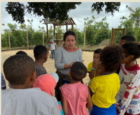
Atividades com os alunos da Escola Municipal Córrego das Palmeiras em Conceição da Barra/ES