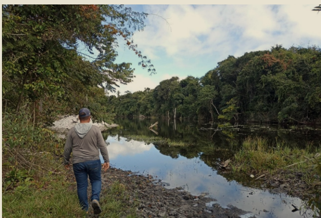
Diagnóstico de área de restauração em São Sebastião em Teixeira de Freitas/BA

Nos dias 02, 03, 05, 08, 10, 11, 17 e 30 de agosto foram realizados diagnósticos de áreas para implantação dos sistemas agroflorestais e restauração de nascentes e APPs no Assentamento Paulo Freire, Comunidade de Rancho Queimado, Assentamento Riacho das Ostras e Comunidade de São Sebastião, todas localizadas em municípios do sul da Bahia. Nas visitas, as famílias apresentaram as áreas de interesse referente ao projeto para equipe técnica do Pomares, foram realizados registros, dimensionamentos e piqueteamento para a continuidade das atividades de implantação dos sistemas agroflorestais – SAFs e restauração florestal. Até o momento foram diagnosticados 34,7 hectares de áreas para implantação de sistemas agroflorestais e 10,9 hectares de áreas para restauração florestal.