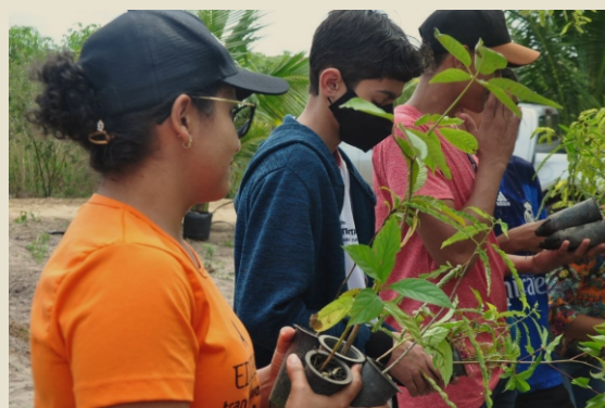
Plantio de restauração em Jardim Novo, Teixeira de Freitas/BA.