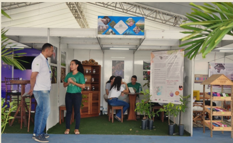
Stand na 38ª Exposição Agropecuária de Teixeira de Freitas/BA

O Programa Arboretum foi convidado a divulgar o projeto Pomares da Mata Atlântica em um stand na 38ª Exposição Agropecuária de Teixeira de Freitas/BA, evento que recebe público de toda a região, ótima oportunidade para tornar ainda mais conhecido o projeto e também para realizar a abertura do cadastramento dos produtores interessados.