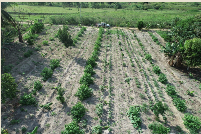
Plantio de Sistema Agroflorestal