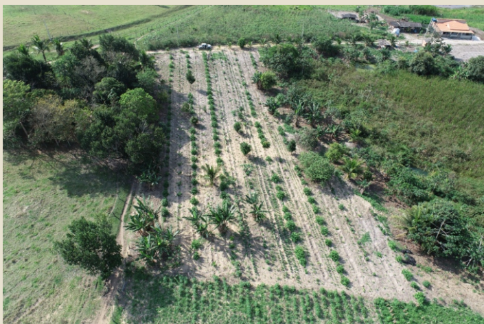
Plantio de Sistema Agroflorestal

A continuidade dos plantios de sistemas agroflorestais e restauração florestal no mês de setembro se deu no Assentamento Paulo Freire em Mucuri/BA, comunidade de Arara em Teixeira de Freitas/BA e Assentamento Rio Preto-Itaúnas/100 Alqueires, comunidade Córrego das Palmeiras e Córrego do Sertão em Conceição da Barra/ES. Em setembro foram mais de 6 hectares implantados, os quais, somados aos meses anteriores atingem mais de 14 hectares de plantios. Também estão sendo realizados os diagnósticos de áreas e no mês de setembro as comunidades foco foram: São Sebastião em Teixeira de Freitas/BA e Rancho Queimado em Alcobaça/BA, onde já foi iniciado as atividades de preparo de solo.