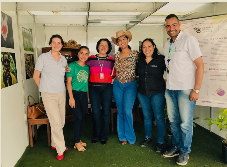
Stand na 38ª Exposição Agropecuária de Teixeira de Freitas/BA