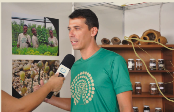
Stand na 38ª Exposição Agropecuária de Teixeira de Freitas/BA

O Stand para divulgação do projeto foi cedido através de uma parceria junto ao SEBRAE e o período da exposição foi de 14 a 18 de setembro. Além da divulgação no stand do Programa Arboretum, mais dois parceiros apoiaram esse processo durante a exposição: O Instituto Federal Baiano e o Sindicato dos Produtores Rurais de Teixeira de Freitas, através da distribuição de folders e orientações aos interessados em procurarem o stand do programa. Entre os dias 14 e 30 de setembro, foram realizados mais de 300 cadastros de produtores interessados em receber as mudas frutíferas do projeto pomares, mais de 39% dos cadastrados solicitaram a retirada da maior quantidade de mudas disponíveis, “Pomar Grande” - 75 mudas, demonstrando o grande interesse dos produtores rurais em pomares de frutíferas nativas. Nesse período foram solicitadas mais de 15.000 mudas através do cadastro. Considerando o espaçamento médio previsto entre as plantas de 5 metros por 5 metros, 15.000 mudas devem ocupar uma área total de 37,5 hectares distribuídos nos “Pomares da Mata”. O início de retirada das mudas está previsto para janeiro de 2023, cada produtor receberá, em sua primeira retirada conforme solicitado em seu cadastro, uma caixa contendo 25 mudas e um guia com informações sobre as espécies de frutíferas nativas. O cadastro continua aberto e os interessados podem acessá-lo no site do projeto Pomares da Mata Atlântica através do link: https://www.pomaresdamataatlantica.eco.br/ .