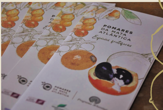
Stand na 38ª Exposição Agropecuária de Teixeira de Freitas/BA